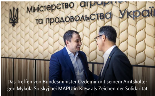
Das Treffen von Bundesminister Özdemir mit seinem Amtskollegen Mykola Solskij bei MAPU in Kiew als Zeichen der Solidarität

Über die German Food Bridge konnten seither über 500 LKW-Ladungen an Lebensmitteln in die vom Krieg am stärksten betroffenen Regionen in der Ukraine geliefert werden. Die enge Zusammenarbeit zwischen NGOs, Politik und Wirtschaft ist ein starkes Zeichen der Solidarität mit den Ukrainerinnen und Ukrainern. Darüber hinaus hat das BMEL eine Reihe von Maßnahmen umgesetzt und gestartet, um die Folgen des Krieges zu lindern und beim Wiederaufbau zu unterstützen. Dabei wurde auf fachliche und politische Netzwerke aufgebaut, die bereits vor dem Krieg über das Bilaterale Kooperationsprogramm des BMEL bestanden. Auch der Bilaterale Treuhandfonds (BTF) mit der Internationalen Ernährungs- und Landwirtschaftsorganisation der Vereinten Nationen (FAO) wurde gezielt eingesetzt. Diese Übersicht gibt einen Einblick in das aktuelle BMEL-Portfolio der Zukunfts- und Solidaritätspartnerschaften